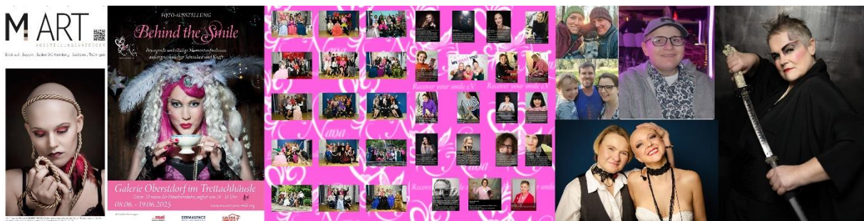
Kollage Ausstellung „Behind the Smile“ Trettachhäusle, Oberstdorf