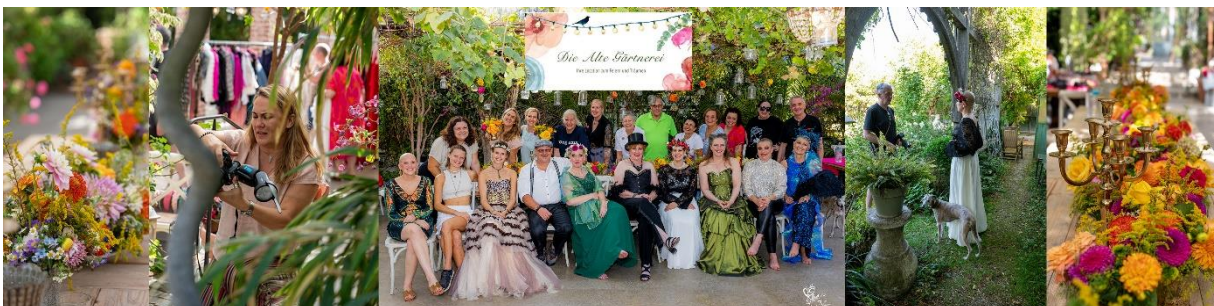
Kollage Alte Gärtnerei 2025