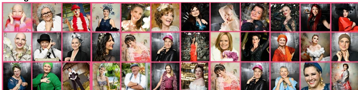
Kollage Auswahl Fotos TN 2025