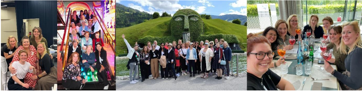
Kollage Swarovski Kristallwelten, Wattens