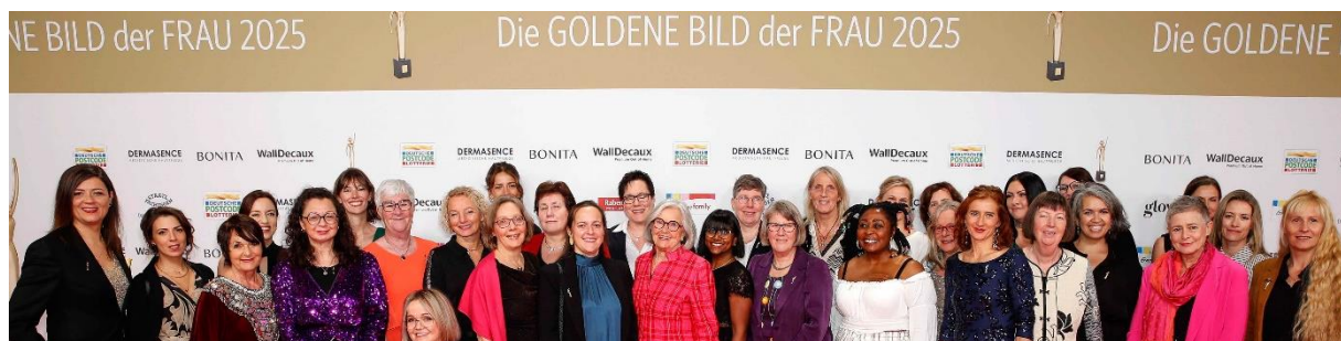
Kollage neue und ehemalige Preisträgerinnen Goldene Bild der Frau 2025

https://www.muenchen.tv/mediathek/video/nana-recover-your-smile-ein-verein-der-das-selbstbewusstsein-und-die-selbstliebe-bei-krebspatientinnen-und-patienten-foerdert/