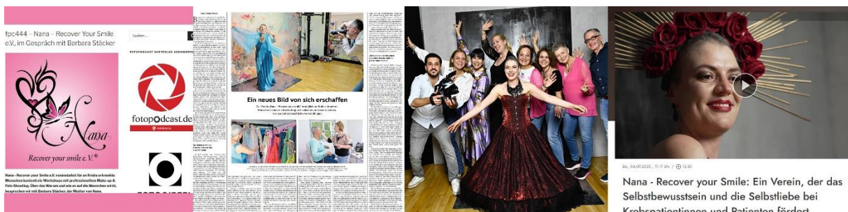
Kollage: fotopodcast.de, Artikel SZ, TV München