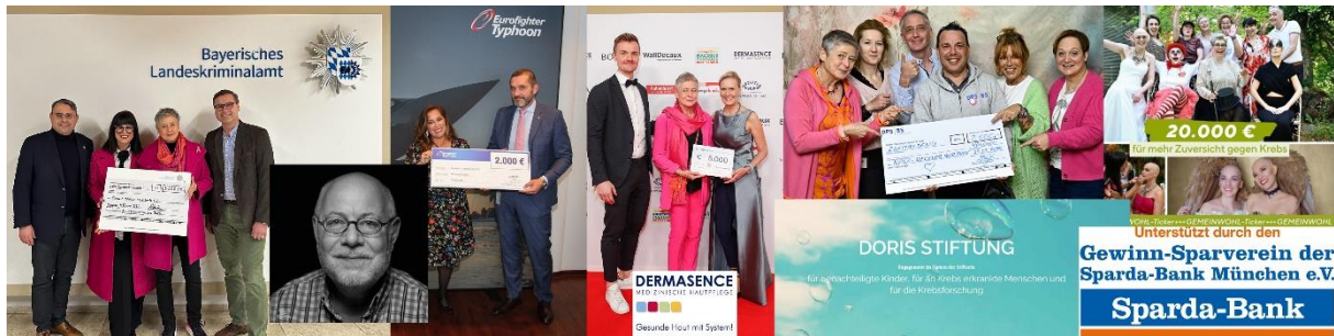
Kollage Spenden/ Förderung 2025