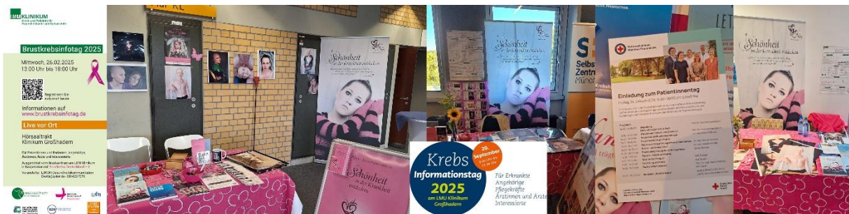
Kollage Infostände 2025

Im Fotoalbum "In loving Memory" bei Facebook und auf der Homepage unter "Erinnerungen" gedenken wir den 2025 verstorbenen TN, falls wir davon erfahren und gleichzeitig eine Veröffentlichungsfreigabe der Fotos haben.