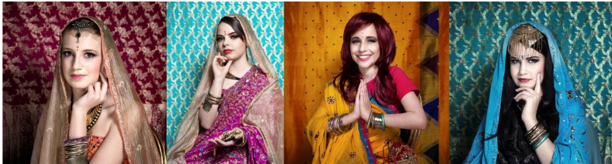
Fototermin mit KONA: Motto "indische Prinzessinnen"

Bei 5 Sessions in Kooperation mit KONA München (Koordinationsstelle psychosoziale Nachsorge für Familien mit an Krebs erkrankten Kindern) www.krebskindernachsorge.de können wir Fotos mit 17 Jugendlichen machen, bei einem weiteren Termin im Herbst, der als Fotoworkshop zum selbst ausprobieren gedacht ist, nehmen 11 Jugendliche mit großer Begeisterung teil.