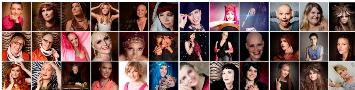
Kollage mit Teilnehmerinnen 2013

Nach den ersten zarten Anfängen unserer Tätigkeit 2012 mit 18 Teilnehmerinnen, kann Nana-Recover your smile e. V. 2013 in 26 Sessions (Nachmittag mit Schminken durch professionelle Make up Artists und anschließendem Fotoshooting) bereits 120 Teilnehmer begrüßen.